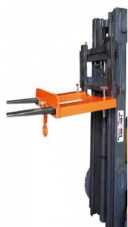
Référence : 376 480

TUBINDUS vous propose une gamme de produits complémentaires pour la manutention, le stockage et la signalisation