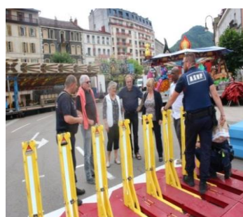
Ville de SAINT CLAUDE