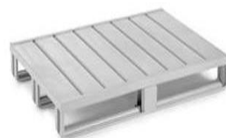
Référence : 376 460