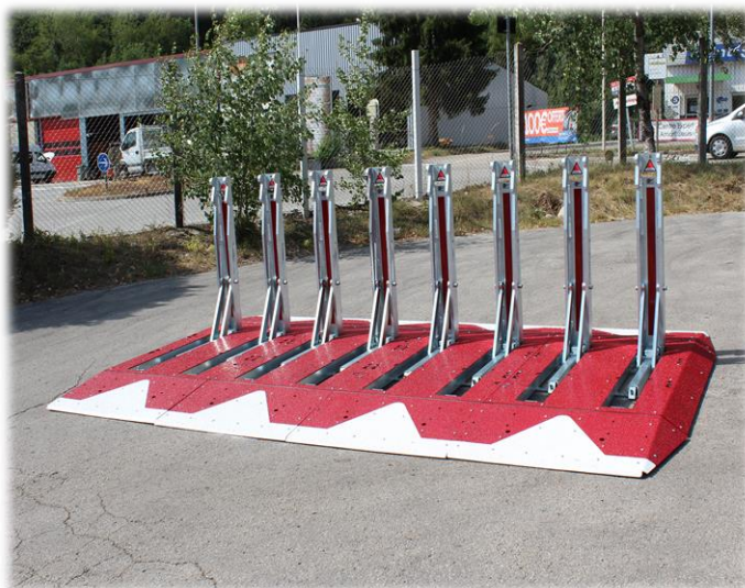
Ralentisseur Anti-Véhicule Bélier RB 376