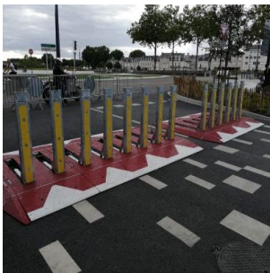
Ville de ANGERS CAPESTANG CHARLEVILLE MEZIERE