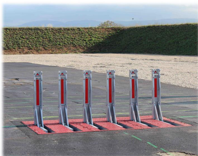
Barrière Encastrée Anti-Véhicule Bélier EB 315