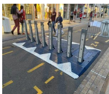
Ville de LE BEAUSSET MULHOUSE LA BAULE