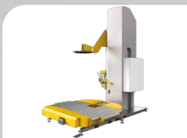
Banderoleuse automatique à convoyeur rotatif, s'intègre dans une ligne automatique.