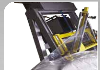
Banderoleuse 5 faces, permet l'étanchéité complète de la charge, largeur de film utilisée 1 mètre.