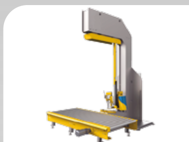
Banderoleuse automatique à bras tournant, idéale pour charges légères et instables, s'intègre dans une ligne automatique.