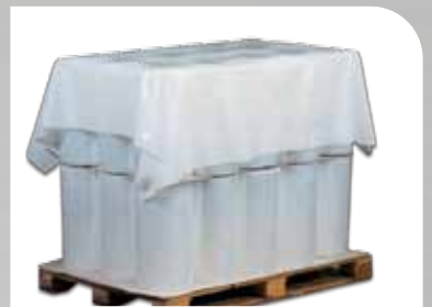
Coiffes palettes en PE, protection pour le dessus ou pieds de palettes avant dépose de film étirable, existent en rouleaux pré-découpés.