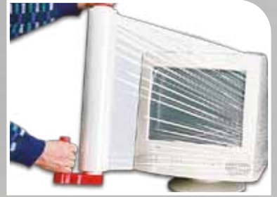
Film étirable manuel standard existe en plusieurs épaisseurs.