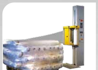
Banderoleuse semi automatique à plateau tournant équipée d'un chariot porte-bobine avec pré-étirage à 250 %.