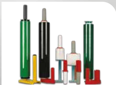
Film étirable manuel possibilité de coloris pour la discrétion de vos articles.