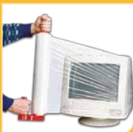
FILM DE PALETTISATION