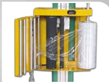
Film étirable pour passage sur machine de dépose, existe en plusieurs épaisseurs et résistances.