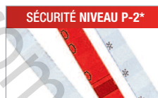
Modèle C/F - 4 mm Pour les documents internes.