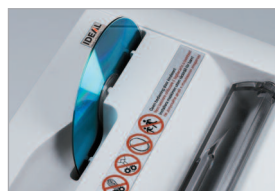
Ouverture spécifique pour les CD/DVDs