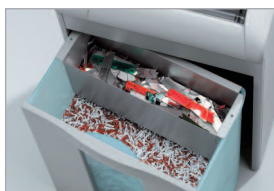
Réceptacle amovible avec séparation des déchets

Modèle C/C - 3x25 mm Pour les documents confidentiels.