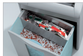
Réceptacle amovible avec séparation des déchets