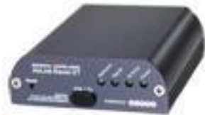
Raven XE Modem Routeur Ethernet / 3G / USB