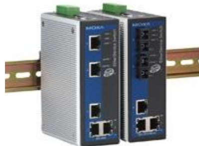
Switch industriel EDS-405A