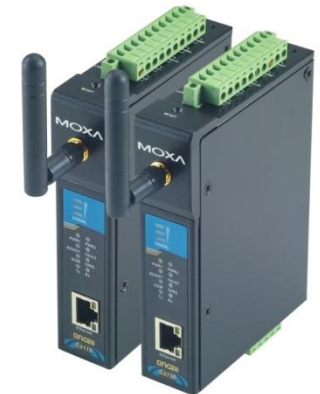
Modem GSM/GPRS/EDGE OnCell G3150