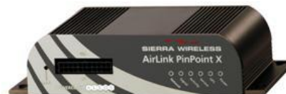
PinPoint X GPS/Ethernet/3G avec E/S