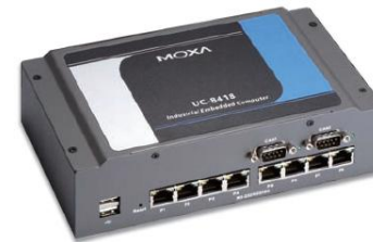
Embedded Computer UC-8418