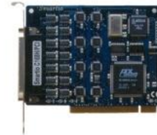
Carte PCI 8 ports série C168HPCI