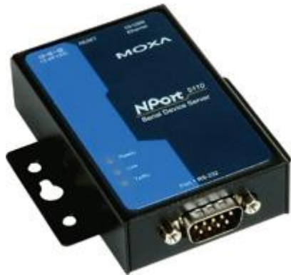
Convertisseur IP/série NPort5110