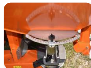
Régulation pont de goutte de l'engrais