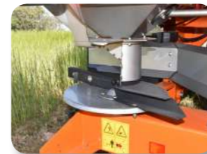
Ailles 12-24 m