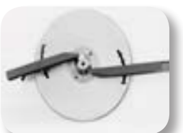
Disque et ailles 33-36m