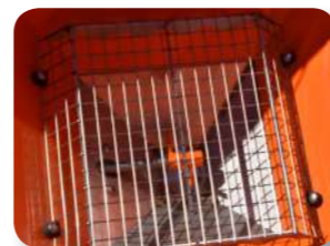
Crible en acier inoxydable