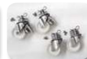
Support avec roues