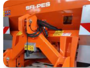
Système de pesage intégré au châssis