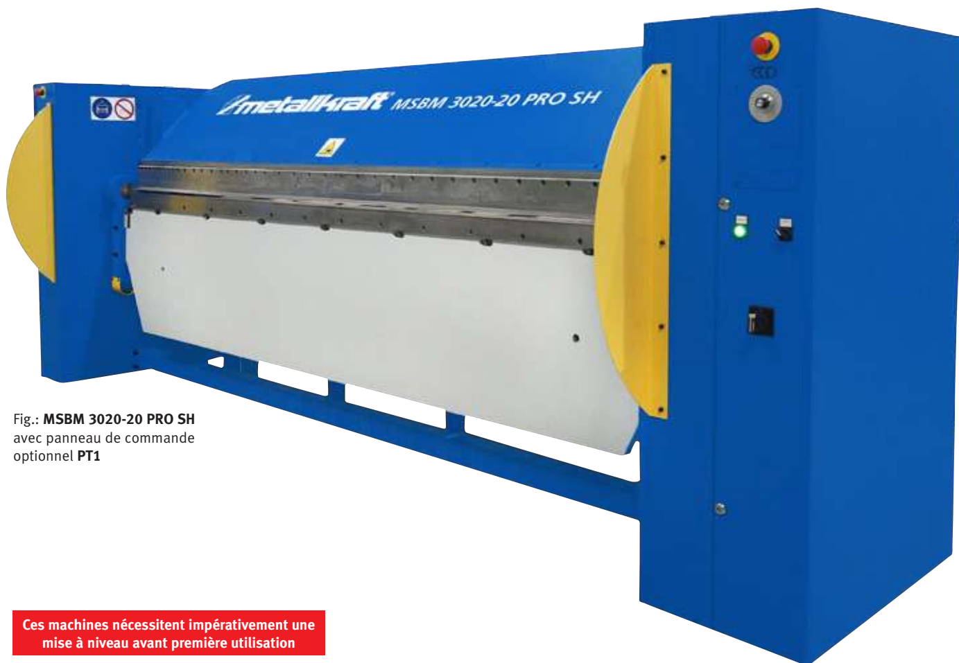
Fig.: MSBM 3020-20 PRO SH avec panneau de commande optionnel PT1

Ces machines nécessitent impérativement une mise à niveau avant première utilisation