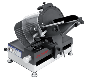
Version titane total