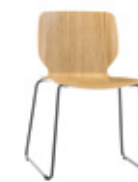
Sled base Pie de varilla