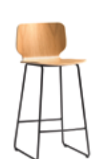
Sled base medium stool Taburete varilla medio