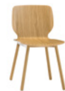
4 wooden legs 4 patas de madera