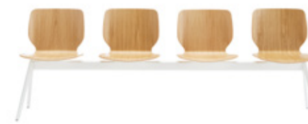
Bench 2-5 seater Banco 2-5 plazas