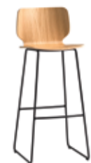
Sled base high stool Taburete varilla alto