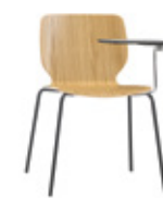
4 leg + tablet 4 patas + pala