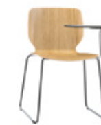
Sled base + tablet Pie de varilla + pala