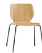
4 leg 4 patas