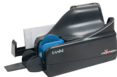
Panini Vision X