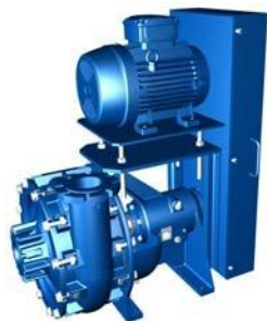
Montage avec entraînement par poulies / courroies