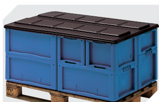
Coiffes pour conteneurs palettisés