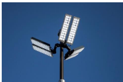
Ensemble projecteurs Leds multi-positions