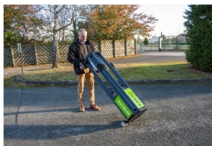
Déplacement et montage faciles