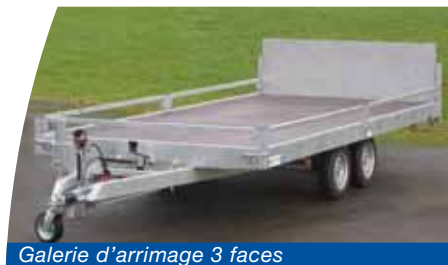
Galerie d'arrimage 3 faces

Cette gamme permet de nombreuses options (ridelles rabattables et amovibles, galerie d'arrimage, timon réglable en hauteur...).