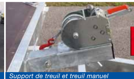
Support de treuil et treuil manuel