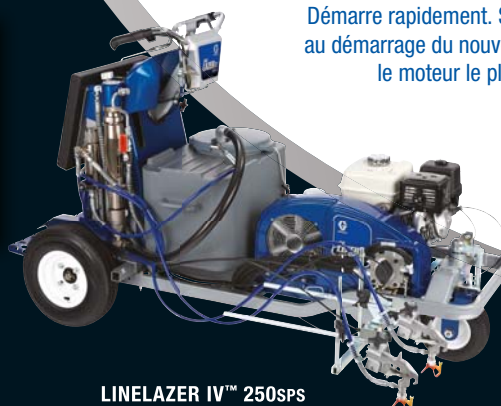
LINELAZER IV™ 250SPS

Démarre rapidement. Supprime toutes les charges au démarrage du nouveau moteur Honda® GX 270, le moteur le plus apprécié des utilisateurs.