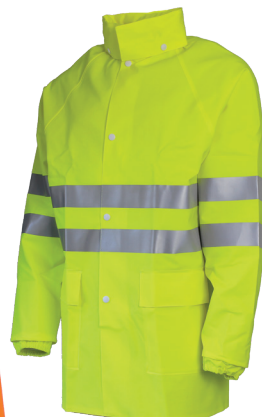
Jaune Fluo 51