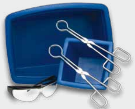
Le CryoKit constitué de : 2 récipients isolants (1 et 4 litres), 2 pinces pour bols de broyage et 1 paire de lunettes de protection

Les bols avec couvercle à vis conviennent particulièrement bien pour le broyage à froid car après le broyage, ils restent hermétiquement fermés à l'air tant qu'ils n'ont pas atteint la température ambiante. Ils préviennent ainsi la condensation de l'humidité atmosphérique sous forme de vapeur d'eau sur la mouture refroidie ainsi qu'une éventuelle pénétration d'eau dans l'échantillon, ce qui risquerait de fausser les résultats de l'analyse. Les bols en agate et en céramique ne doivent néanmoins pas être refroidis avec de l'azote liquide afin d'éviter qu'ils ne soient endommagés lors du processus de broyage.