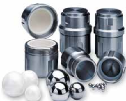
Bols avec couvercle à vis pour le MM 400

Outre les bols de broyage standard avec couvercle emboîté pour le MM 200, vous pouvez aussi recourir aux bols avec couvercle à vis aux avantages multiples pour le MM 400.