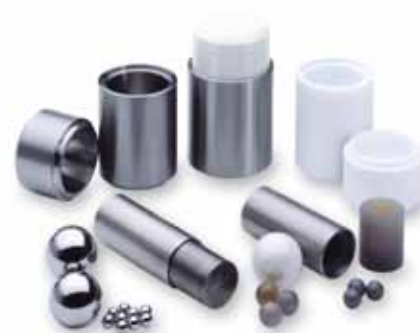
Bols avec couvercle emboîté pour le MM 200