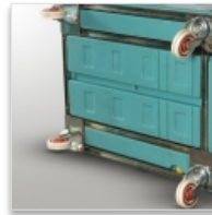
Châssis encastré, acier anti-corrosion 2 roues fixes - 2 roues pivotantes Ø 125 mm