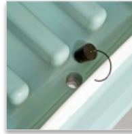
Bonde de vidange en fond de cuve