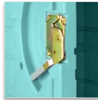
Fermeture rapide 2 points type « pélican » en acier zingué bichromaté