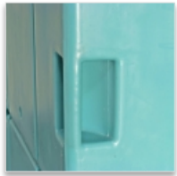
2 poignées de maintenance venant de moulage