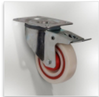
2 roues à frein Ø 125 mm