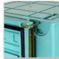
Joint EPDM en cadre monobloc. Système d'arrêt de porte ouverte.