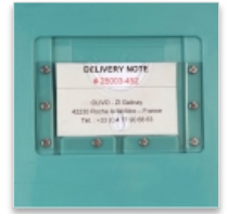
Porte étiquette encastré