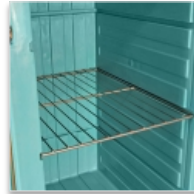
1 à 3 grilles inox