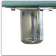
4 pieds métalliques Ø 80 mm