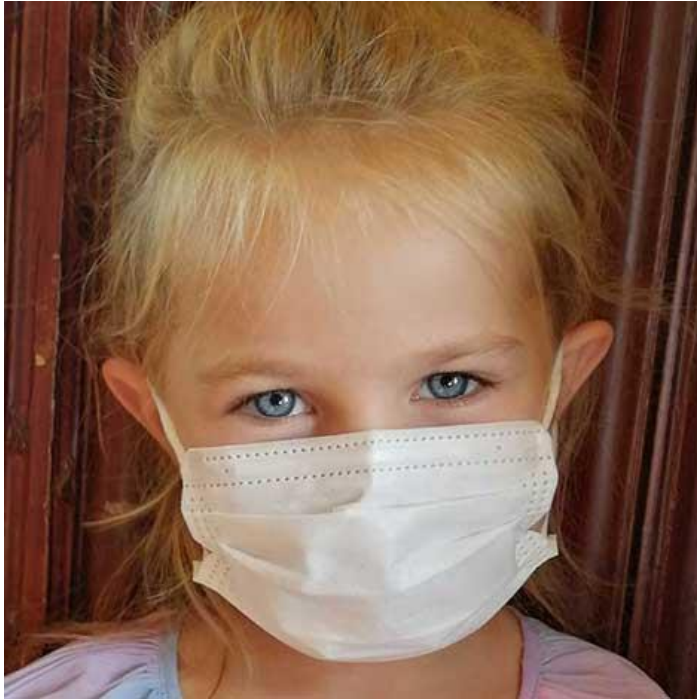
VUE DE FACE MASQUE SUR VISAGE