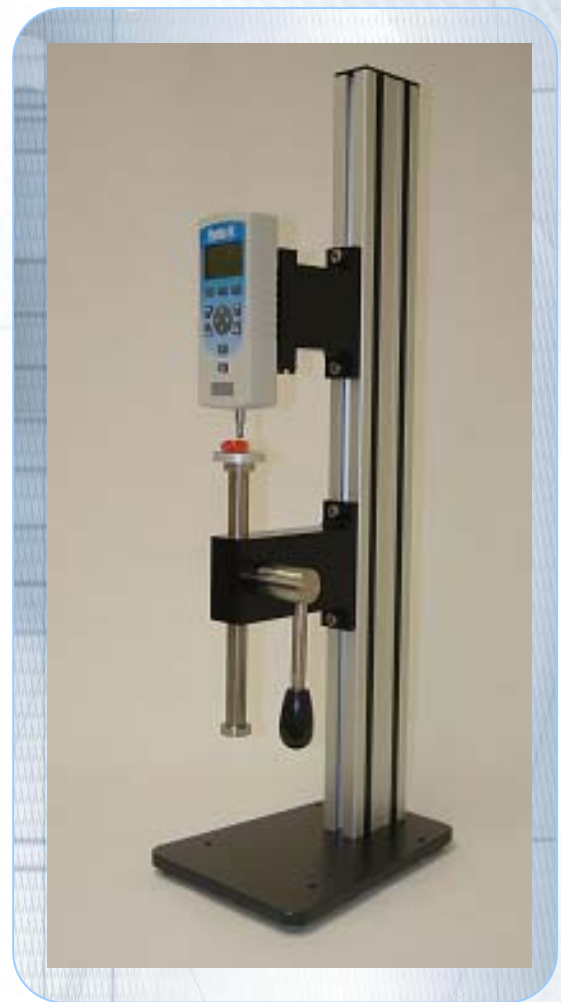
MT500L (levier) avec DFS