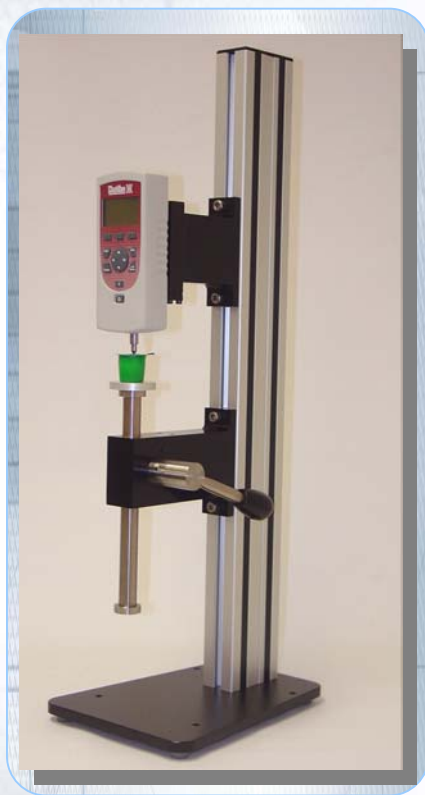
Supports MT500L (levier) avec DFE

A = 750, 1000, ou 1500 mm - B = 290 mm - C = 215 mm - D = 152 mm.