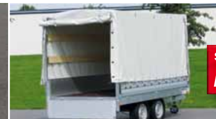
Ridelles aluminium et bâche haute