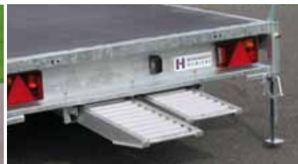
Logement de rampes, rampes, béquilles