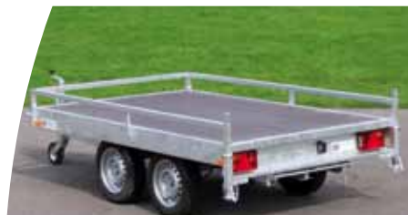
Galerie 3 faces

En plus de leurs qualités techniques, ces remorques proposent en série un plancher bois antidérapant, une flèche en V et un éclairage encastré. Cette gamme propose de nombreuses options (ridelles aluminium rabattables et amovibles, bâche haute, galerie, rampes...).