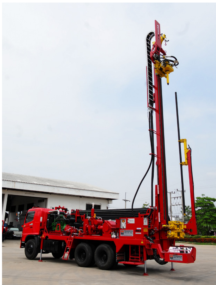
Caricatore aste con braccio Pipe loader Chargeur de tiges Bohrgestänge-lader Cargador de barras Автопогрузчик штанг