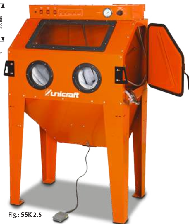
Fig.: SSK 2.5