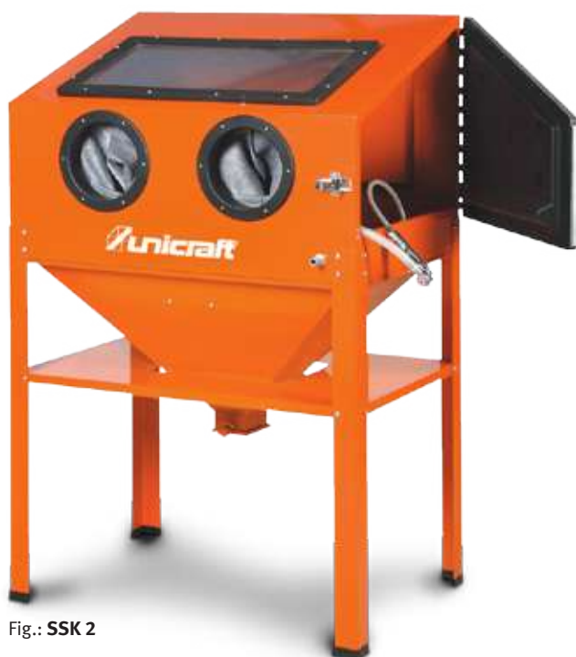
Fig.: SSK 2