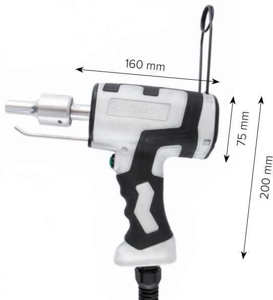
HG35-EC / HG35-RS