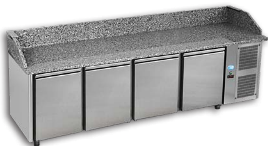
PIZ 4P 800

ACIER INOX - Avec 4 portes - Possibilité groupe à gauche