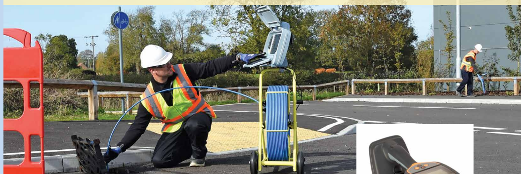
Touret de plomberie P341