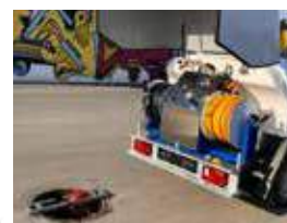
Version «PLUS», radiocommande multifonction et enrouleur hydraulique Version «PLUS», Multifunktions-Funksteuerung und Hydraulikschlauchtrommel