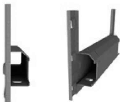
Lisse pour pneus th. 1.5