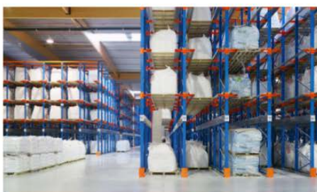
Rayonnage drive-in et accumulation