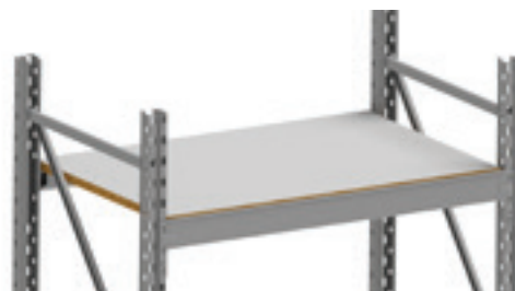
Panneau aggloméré mélaminé