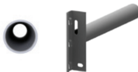
Longeron penderie Ø 35 th. 2