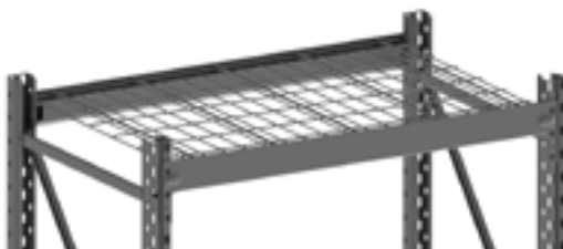
Panneaux fils posés posé sur les lisses ou directement accroché (à l'aide de clips) sur les montants