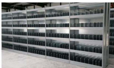
Rayonnage à tablettes