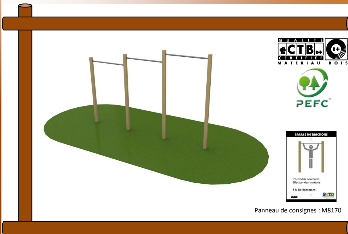
Panneau de consignes : M8170