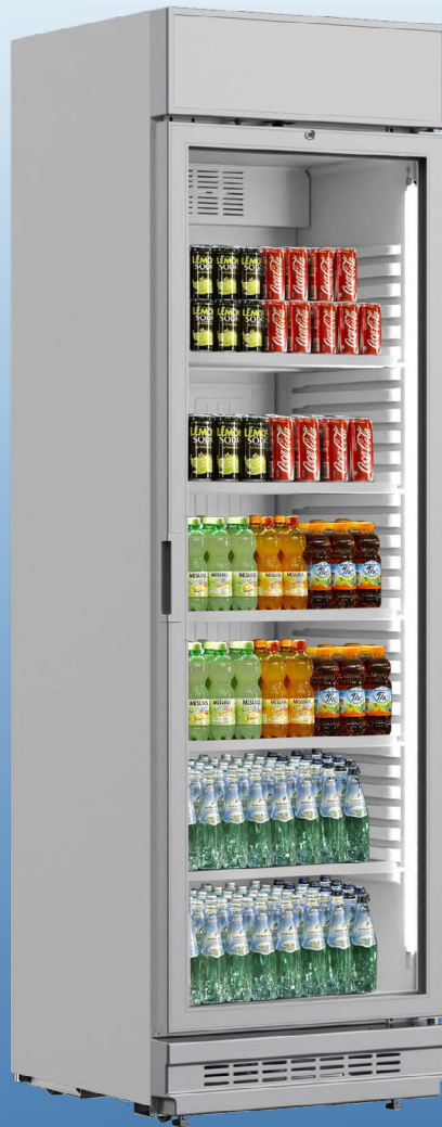
FIZZ 42 WHITE