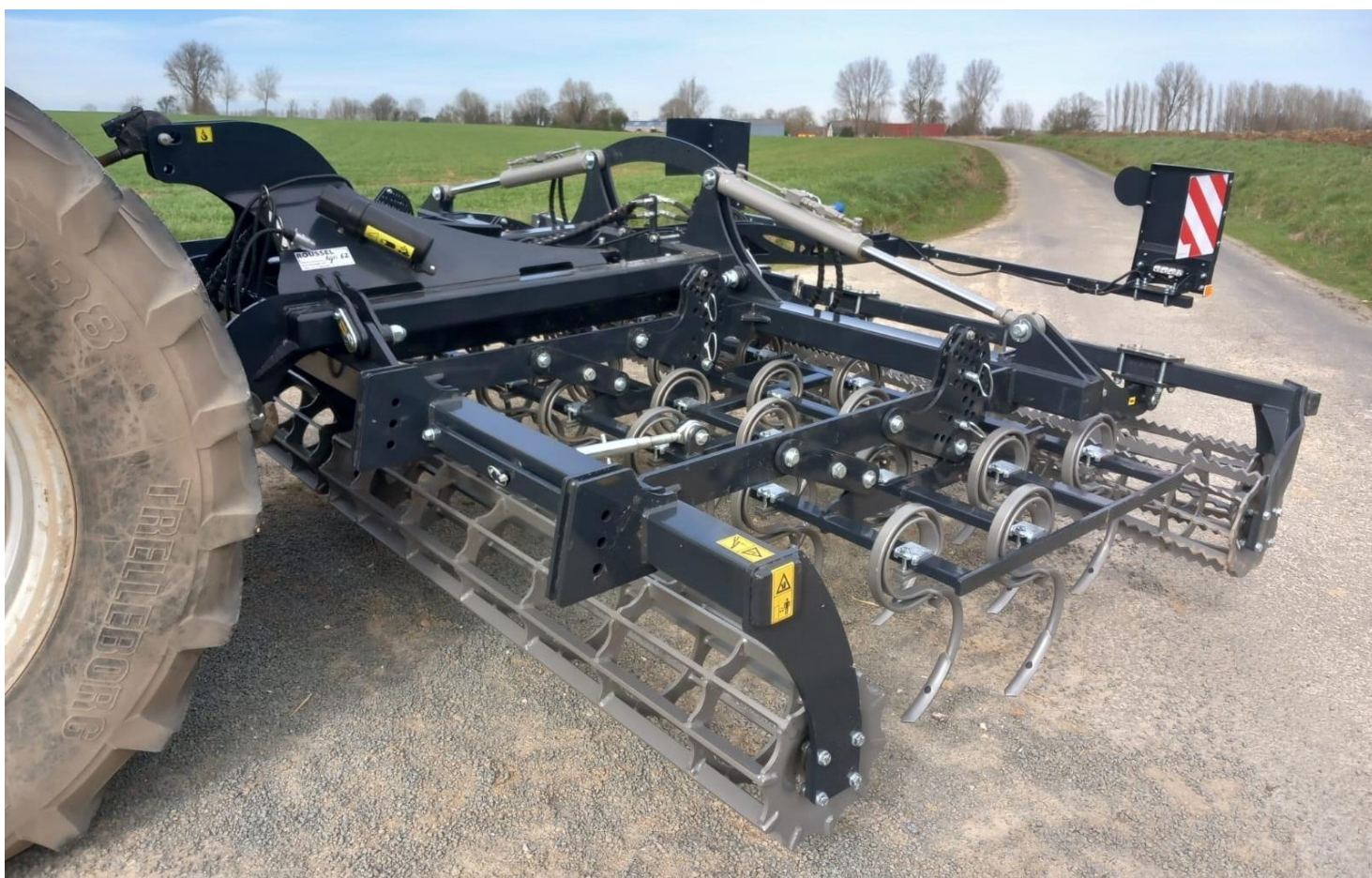
Modèle 4m repliable