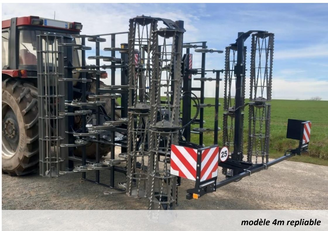
modèle 4m repliable