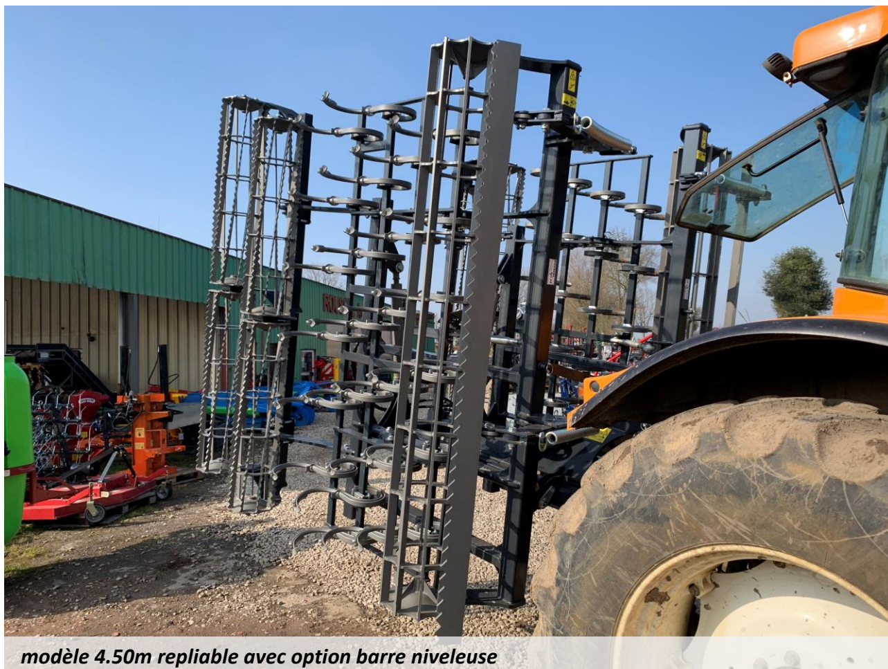
modèle 4.50m repliable avec option barre niveleuse