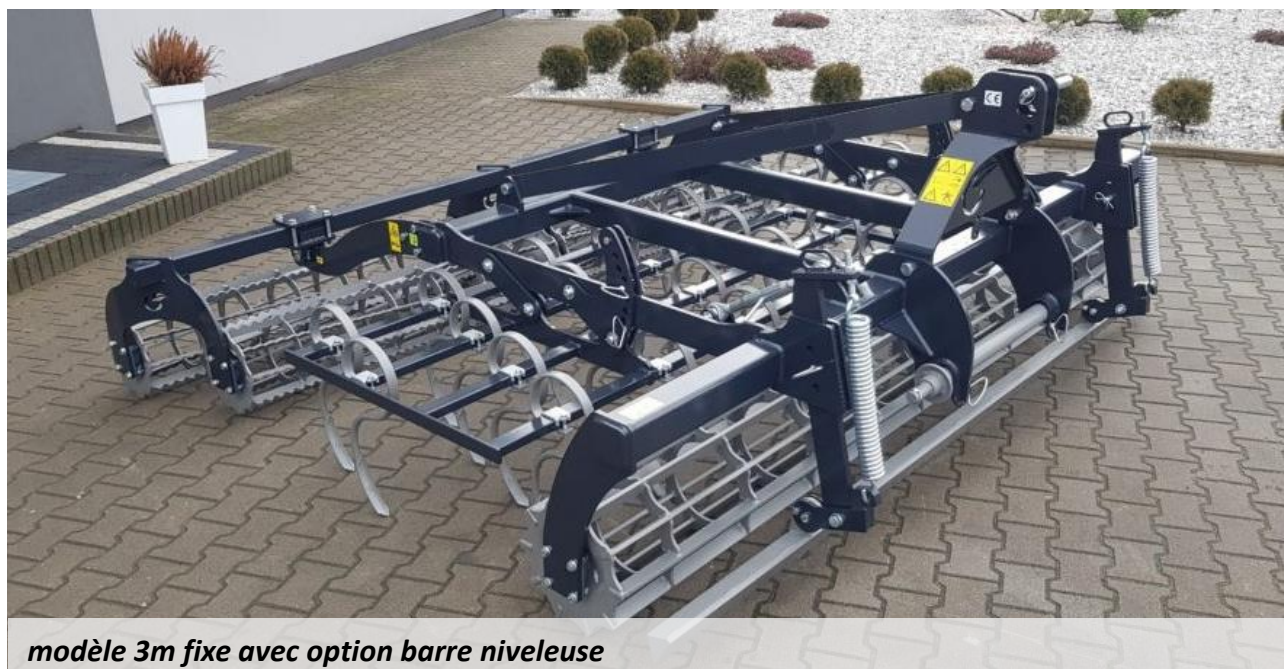
modèle 3m fixe avec option barre niveleuse

- Informations non contractuelles - Nous contacter pour toute demande spécifique