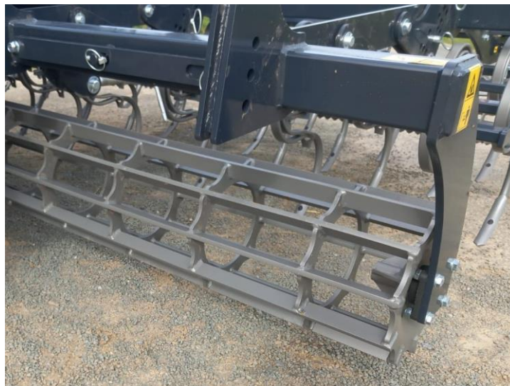
option barre niveleuse