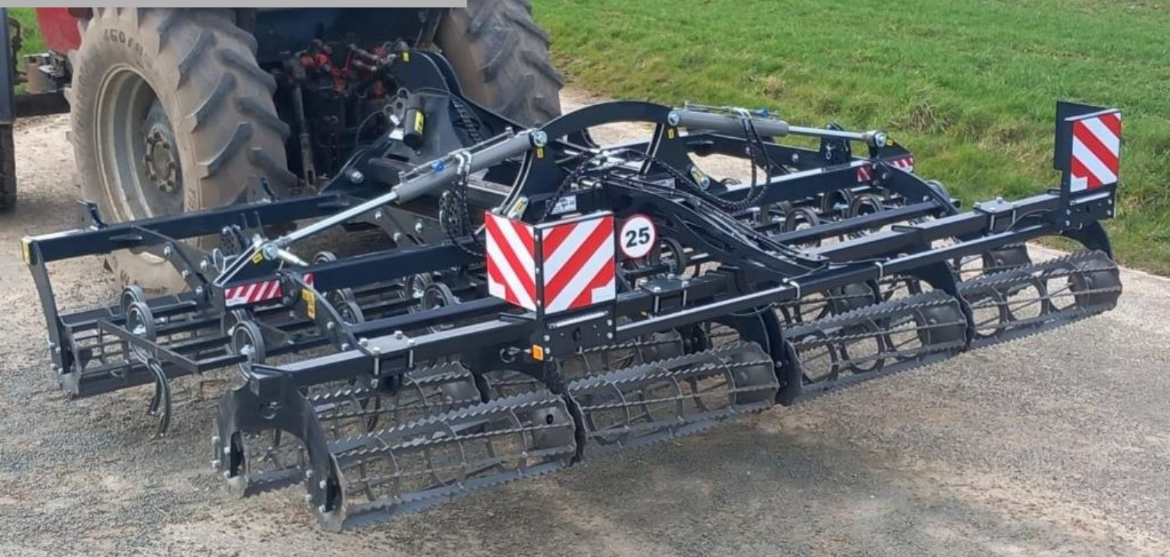
modèle 4m repliable