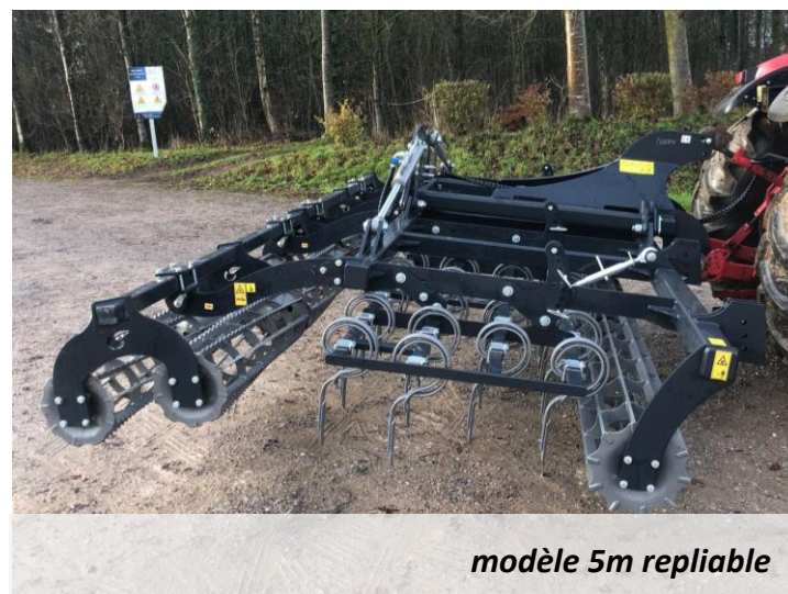
modèle 5m repliable