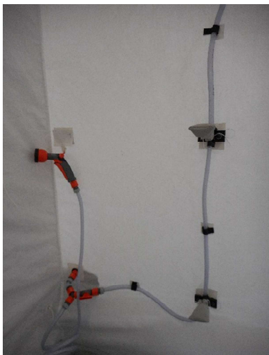
Armature de douche souple fixée sur la toile de couverture