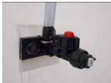
5 Buses équipée d'une vanne