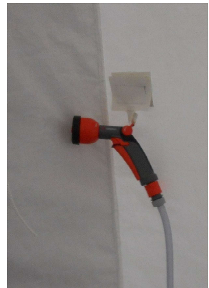
Poire de douche