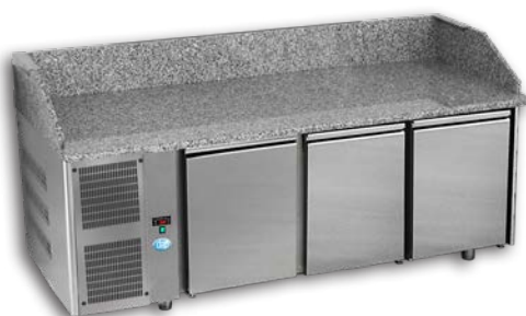
Groupe à gauche