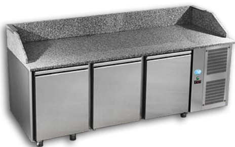
PIZ 3P 800

ACIER INOX - Avec 3 portes - Possibilité groupe à gauche