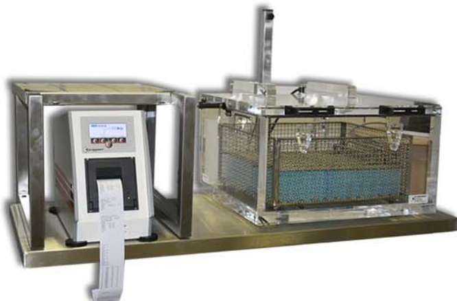
VB sur table INOX