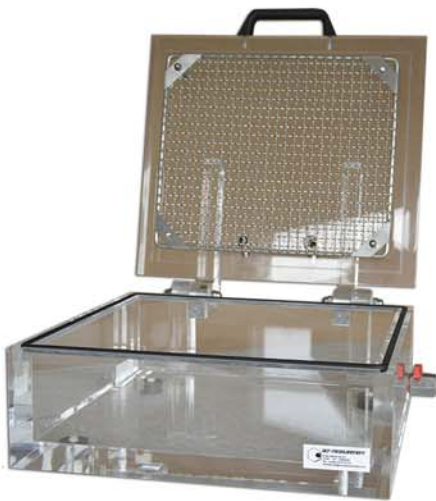
VB petit modèle

Nous avons, en option, une table INOX vous permettant de disposer d'un ensemble compact et mobile.