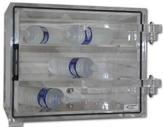
VB porte frontale