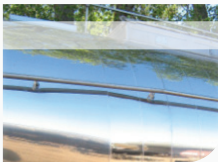
[ Remplacement d'une virole inox sur citerne calorifugée ]