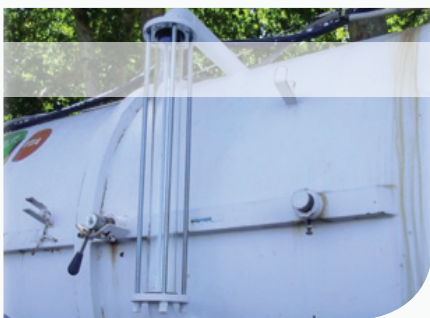
[ Pose d'un tube de niveau ]