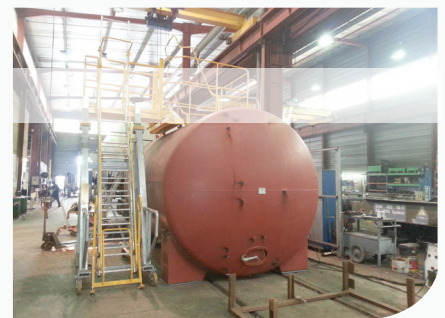
[ Cuve en cours de transformation ]