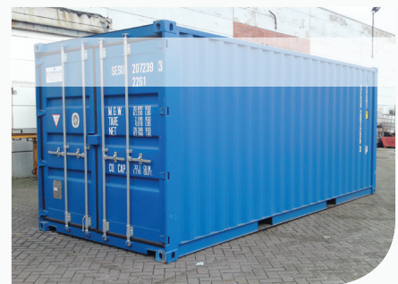
[ Aménagement intérieur stockage produit liquide ]