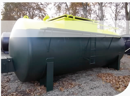
[ Cuve de type DFCI ]