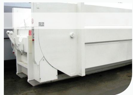
[ Réfection totale de la face avant d'un compacteur à déchet ]