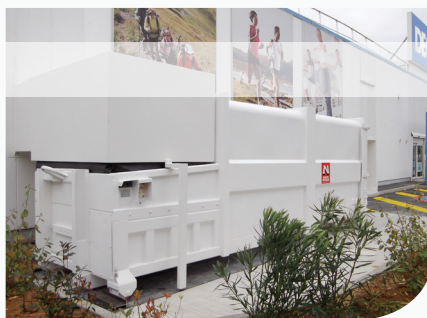
[ Confection et pose d'un tunnel pour compacteur déchet ]