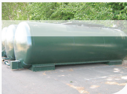
[ Cuve de récupération eaux de pluie ]