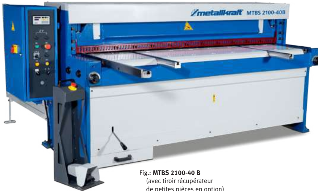
Fig.: MTBS 2100-40 B (avec tiroir récupérateur de petites pièces en option)