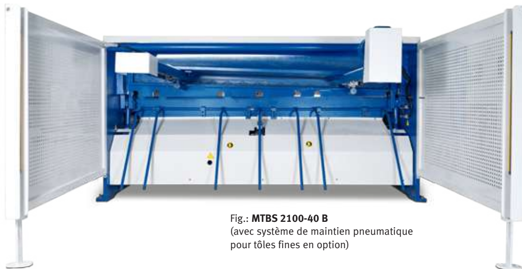
Fig.: MTBS 2100-40 B (avec système de maintien pneumatique pour tôles fines en option)