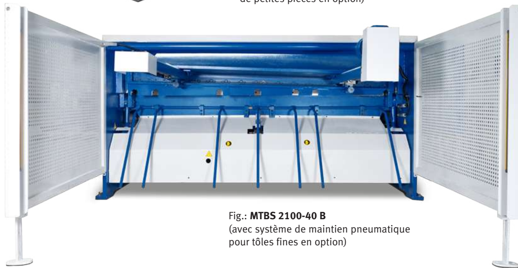
Fig.: MTBS 2100-40 B (avec système de maintien pneumatique pour tôles fines en option)