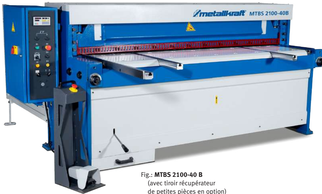
Fig.: MTBS 2100-40 B (avec tiroir récupérateur de petites pièces en option)