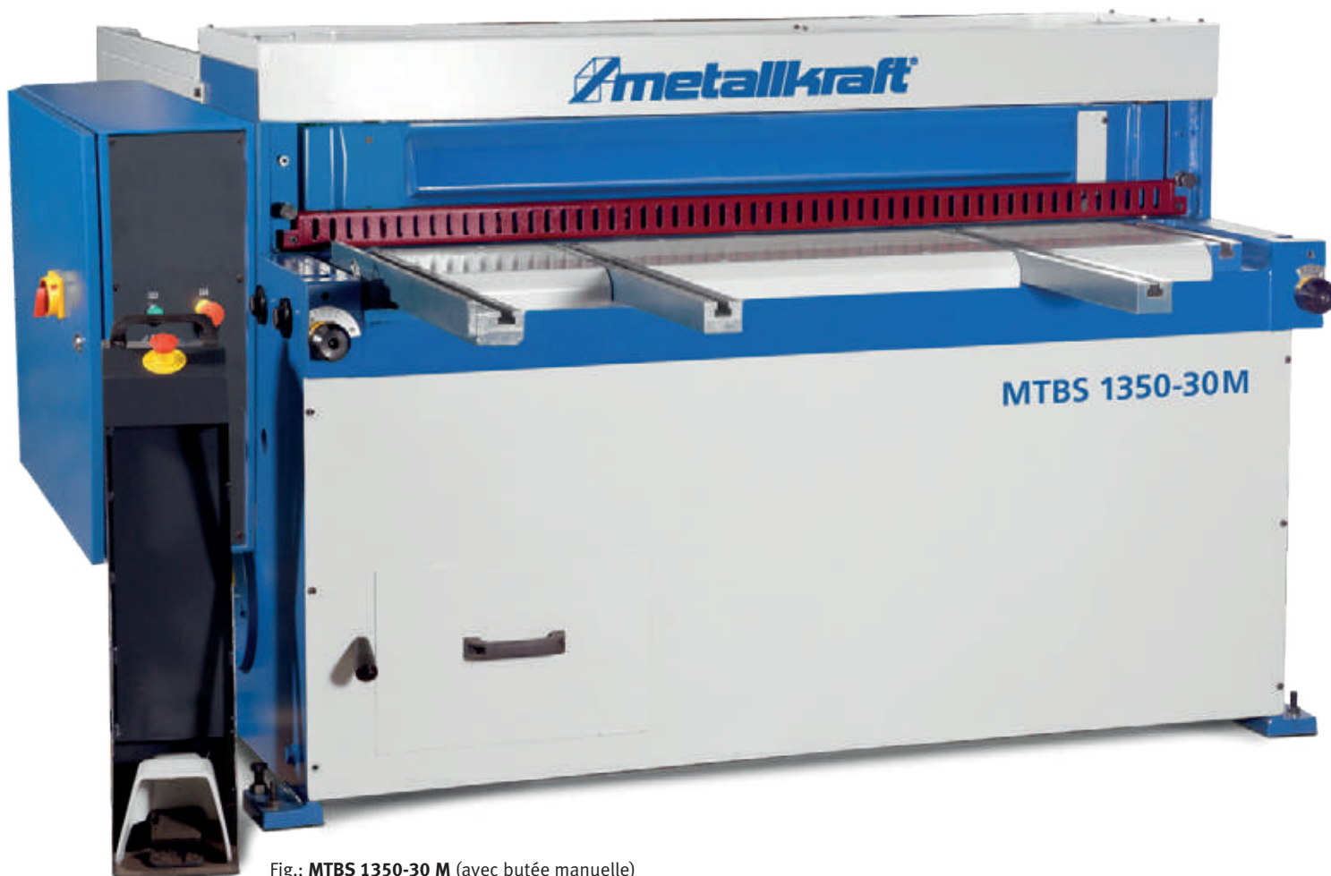
Fig.: MTBS 1350-30 M (avec butée manuelle)