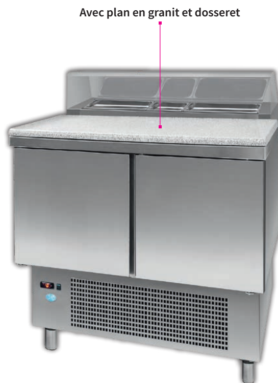
SA 2P GR+TOP INOX V