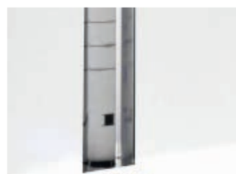
INDICATEUR DE NIVEAU