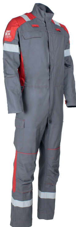
Gris Acier/Rouge 20R