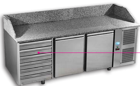
PIZ 3P 800 T6

ACIER INOX - Avec 3 portes et 6 tiroirs neutres - Possibilité groupe à gauche