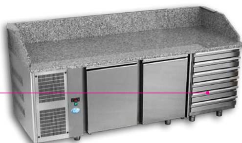
Groupe à gauche PIZ 3P 800 T6 GAG

T6: 6 tiroirs neutres avec bacs à pâtons 600x400 fournis