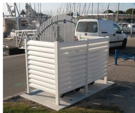
Ex : Cache Conteneur de Port Camargue