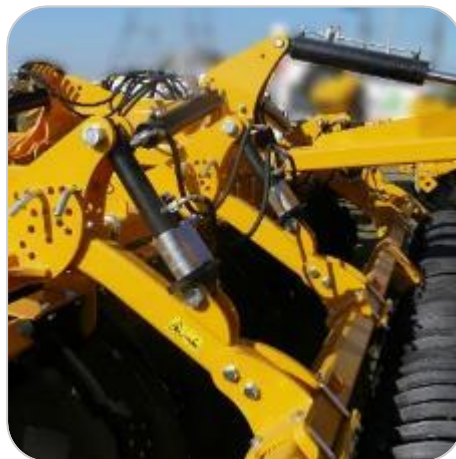
Réglage hydraulique de la profondeur de travail (sur modèles repliables)