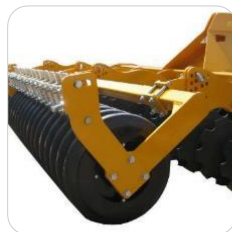
Rouleau sillonneur caoutchouc \varnothing 500