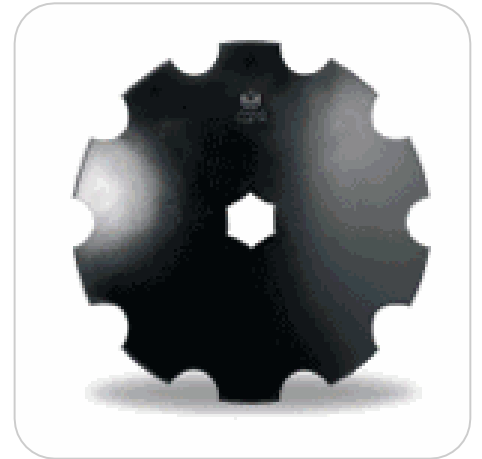
2 rangées de disques OFAS Ø510, Ø560 ou Ø610