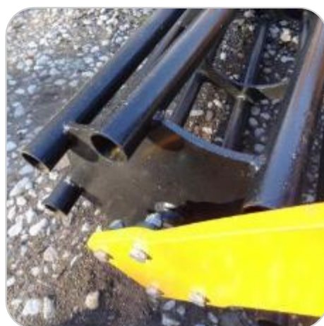
Rouleau tubes \varnothing 500 ou \varnothing 600