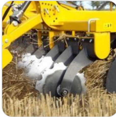
Supports de disque en acier HLE