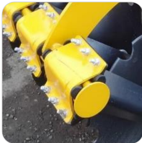
Suspension élastomère indépendante pour chaque disque