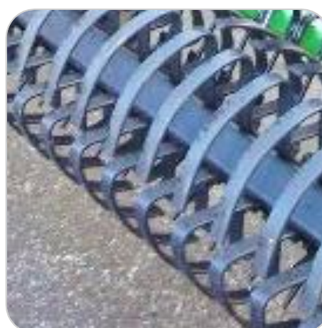
Rouleau flex-ring \varnothing 500