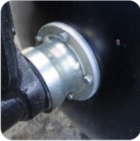
Paliers sans entretien SKF Agri Hub