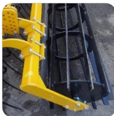
Rouleau barres plates \varnothing 500 ou \varnothing 600