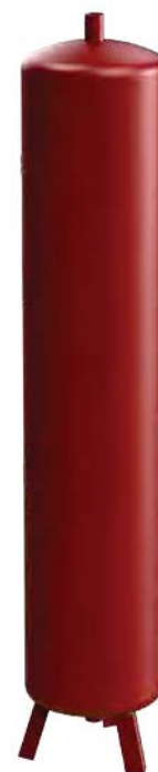
Bouteille de base