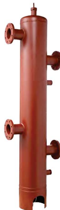
“Réalisation sur mesure”