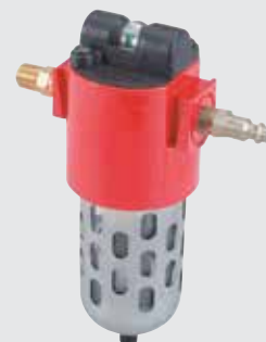
Kit de filtration de l'air