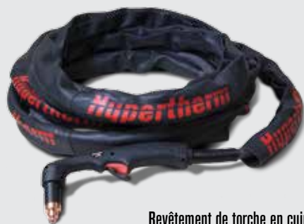
Revêtement de torche en cuir