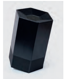
Noir mat RÉF. 8 77 2127-BK