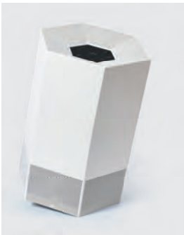
Blanc crème RÉF. 8 77 2127-WH