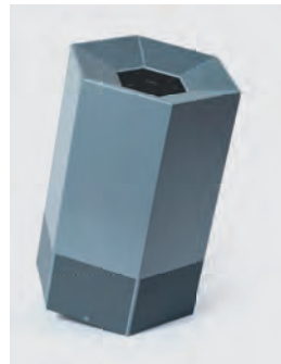
Bleu Saphir RÉF. 8 77 2127-BL