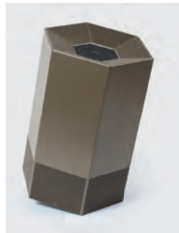
Bronze RÉF. 8 77 2127-BR