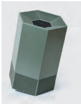
Vert Malachite RÉF. 8 77 2127-GR