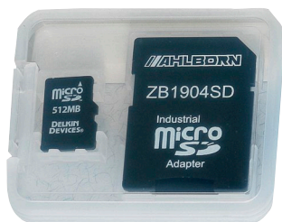
Carte mémoire Micro-SD (de rechange)