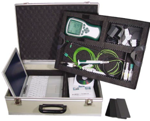
ZB 2590 TK2