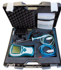
ZB 2490 TK2