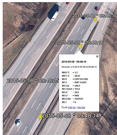
Visualisation des données de suivi et de mesure dans Google Earth (exemple)