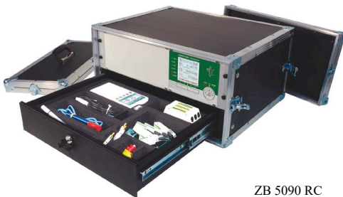
ZB 5090 RC