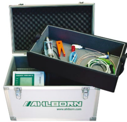
ZB 5600 TK3