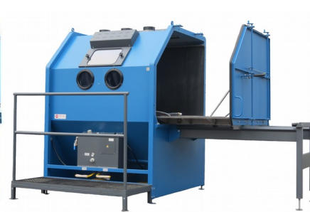
PF 1515E + CHAR3