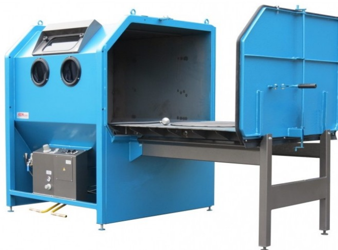
Chariot de chargement et plateau tournant CHAR3