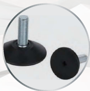
Option vérins de mise à niveau