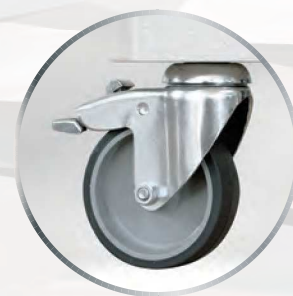
Option pieds avec roulettes pivotantes ø75 ou 125 mm.