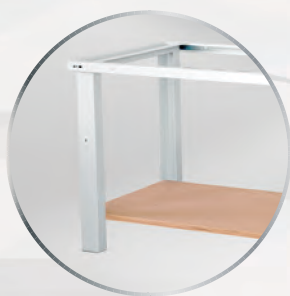
Option tablette basse