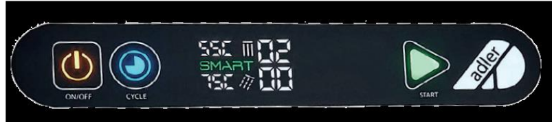
Panneau de commande