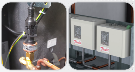
Transducteur de pression Sécurités pressostatiques (selon modèle).