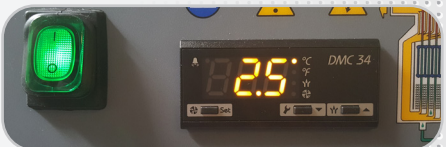
Affichage digital du Point de rosée (tous modèles)