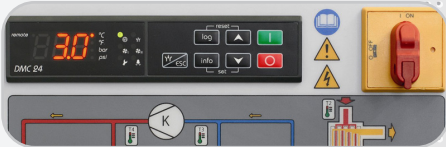
Contrôleur multi-fonctions DMC 24 (ACT 1130 et +)