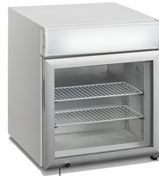
TOP 50 N