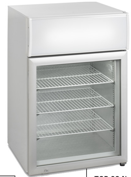
TOP 90 N